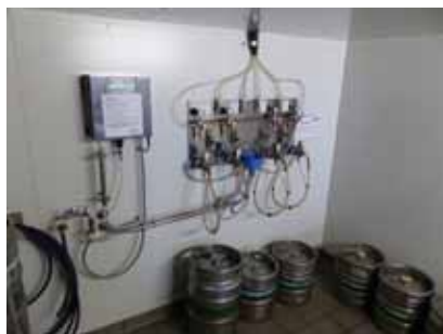
Abb. 9: Automatisches chemisches Reinigungsgerät für Leitungen (Dosiervorrichtung und Steuereinheit)

Beispielhaftes chemisches (Abb. 9) und chemisch-mechanisches Reinigungsgerät (Abb. 10).