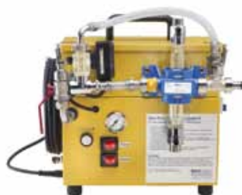
Abb. 10: Mobiles chemisch-mechanisches Reinigungsgerät